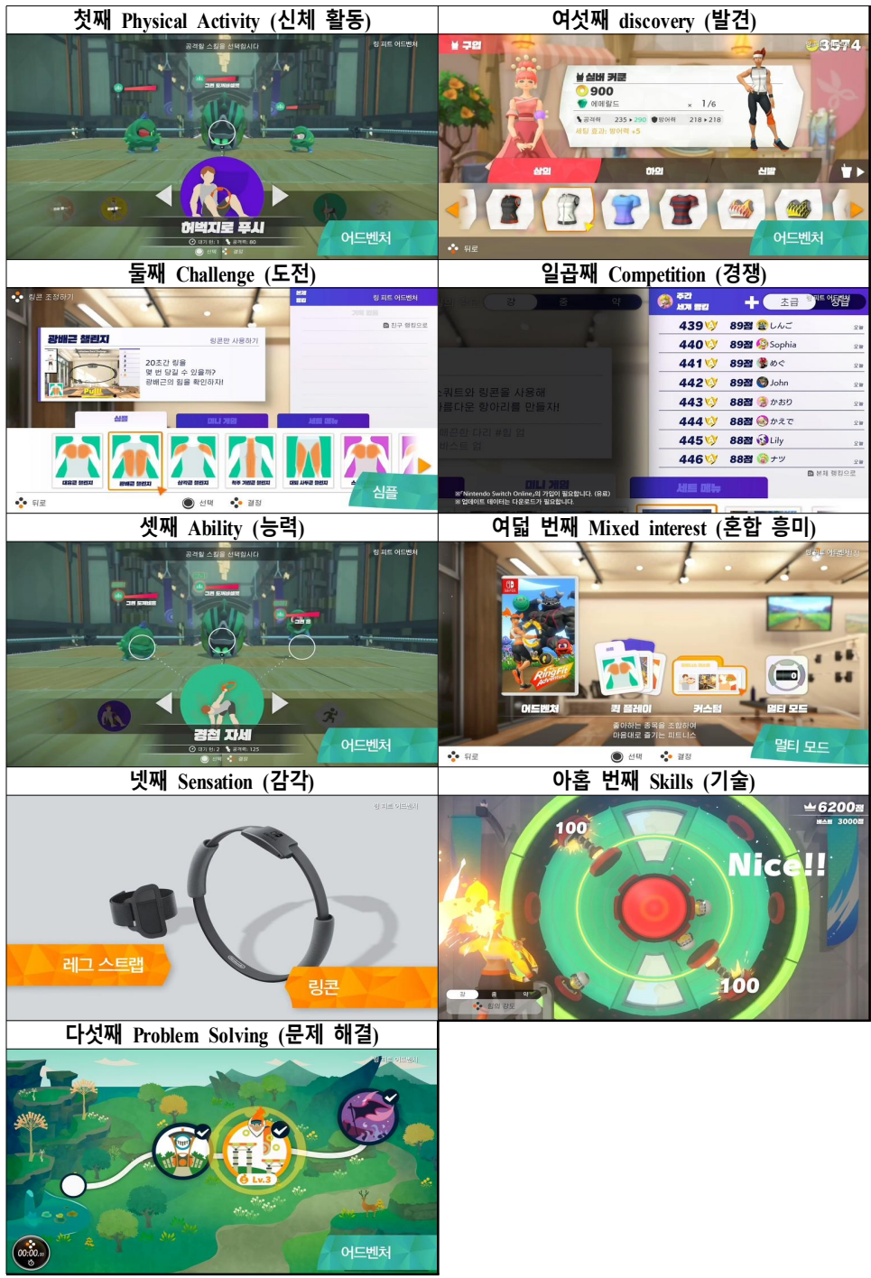
[그림 2] 링피트 어드벤처 게임 재미요소 분류 [Fig. 2] Ringfit adventure game fun factor classification