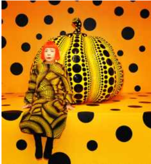
[그림 4] 쿠사마의 호박에 대하여 [15] [Fig. 4] Kusama's with Pumpkin