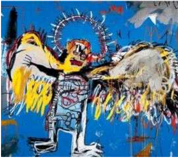
[그림 5] 바스키아의 타락 천사[16] [Fig. 5] Basquiat's Fallen Angel