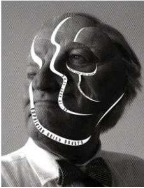
[그림 6] ‘2011 Unfolding Keith Godard’ 전시 포스터[18] [Fig. 6] He jianping's Poster