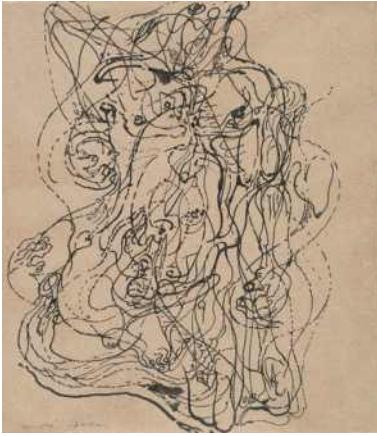
[그림 3] 앙드레 마송의 자동기술법[11] [Fig. 3] André Masson's Automatic Drawing