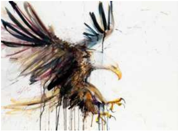
[그림 7] 데이브 화이트의 독수리[19] [Fig. 7] Dave white's Eagle