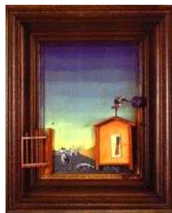
[그림 2] 에른스트의 나이팅게일에 놀란 두 아이[10] [Fig. 2] Ernst's Two Children are Threatened by a Nightingale

앙드레 마송(André Masson, 1896~1987)은 초현실주의의 대표적 화가로 선의 표현성과 충동적 제스처를 실험하며 펜과 잉크에 의한 자동 드로잉(Automatic Drawing) 작업을 했다. 이것은 마음속에 미리 생각한 주제나 선 구상 없이 재빠른 선묘를 보여주며 선의 강렬한 움직임과 잉크의