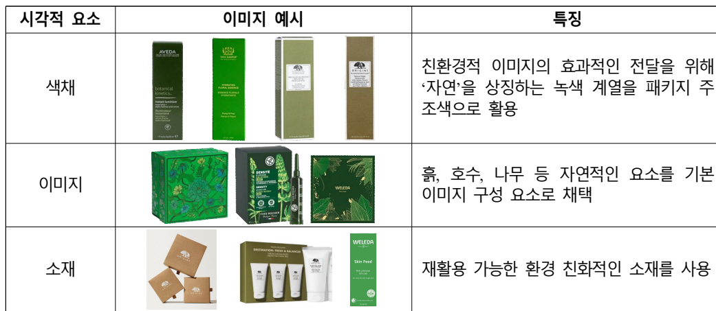
[Table 1] The Design Characteristics of the Package of Naturalistic Cosmetics

2023년 스트레이츠 리서치(Straits Research)의 유기농 스킨케어 시장 보고서(Organic Skin Care Market Report)를 바탕으로 유기농 스킨케어 시장에 진출한 글로벌 브랜드 6개를 대상으로 자연주의 화장품의 패키지 디자인 특징을 분석한다. 분석 대상으로 선정한 브랜드는 브랜드 철학, 사용 성분, 친환경성을 기준으로 선정하며 오리진스(Origins), 아베다(Aveda), 이브로쎬(Yves Rocher), 트루보타니컬스(True Botanicals), 타타 하퍼(Tata Harper), 벨레다(Weleda)가 포함된다 [14]. 구체적인 자연주의 패키지 디자인 특징 분석 결과는 [표 1]과 같이 정리하였다.