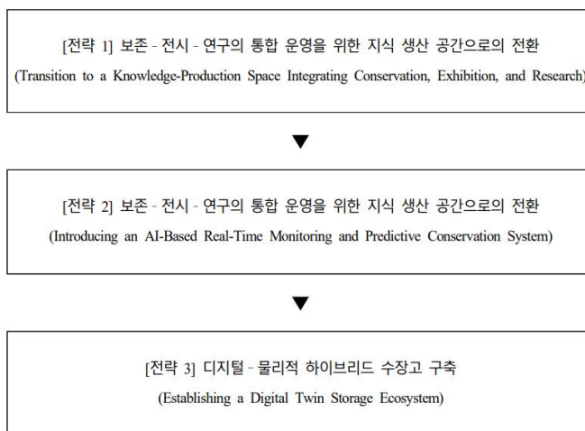
[그림 3] 개방형 수장고 미래지향적 운영 전략 도식화