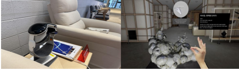
[그림 1] Apple Vision Pro 기기(좌), XR 속 변역된 도자기(우)

디오, 3D 콘텐츠, 상호작용을 통해 체험할 수 있게 하며, 관람객에게 몰입형 학습 경험을 제공한다. 이를 통해 관람객은 물리적으로 접근이 제한된 소장품이나 멀리서만 관람 가능한 작품을 가상 공간에서 눈앞에 재현된 형태로 마주하고, 다양한 각도에서 회전·확대하며 세부를 감상하는 경험을 할 수 있다. [그림 1]은 Apple Vision Pro™(좌)를 활용하여 물리적 수장고 내에 보관된 소장품을 XR 가상 공간에서 3D 콘텐츠로 시각화(우)한 사진이다 [17].