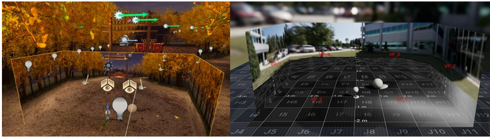
[그림 2] 언리얼 엔진의 nDisplay 모듈을 통해 구현된 CAVE에서의 다중 프로젝터 클러스터 렌더링 [Fig. 2] Multi-projector cluster rendering in a CAVE implemented using the nDisplay module of Unreal Engine