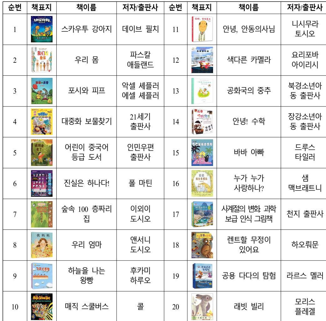
[Table 2] An illustration of a book cover