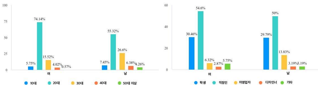
[그림 1] 응답자의 인구 통계적 특성

본 연구에서는 총 268명의 중국 소비자를 대상으로 조사를 진행하였으며, 중국 전통문화를 활용한 패키지 디자인에 대한 이해를 돕기 위해, 코카콜라 제품 구매 경험이 있는 응답자들을 분석하였다. 다음 [그림 1]은 소비자 응답에 대한 빈도 분석을 나타낸 그림이다.