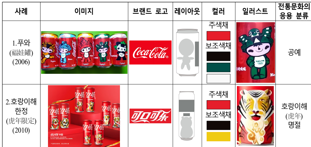
[Table 3] Case Study on Coca-Cola Can Package Design