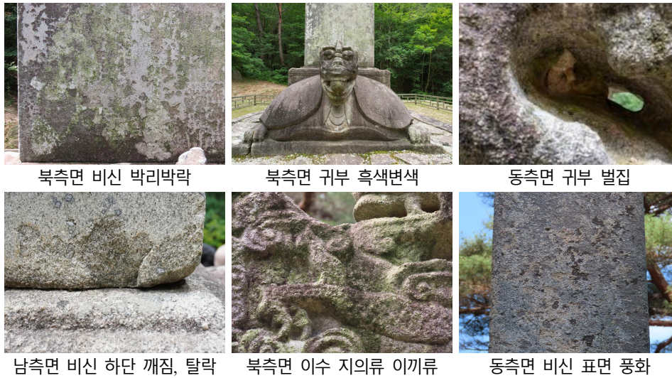
[그림 2] 괴산 각연사 통일대사탑비의 손상 상태

색 변색이 많이 관찰되며, 갈색 변색과 무기질에 의한 황색변색이 탑비의 미적 가치를 떨어뜨리고 있는 실정이다. 또한, 탑비의 동측면 귀부에서 벌집이 확인되었다.