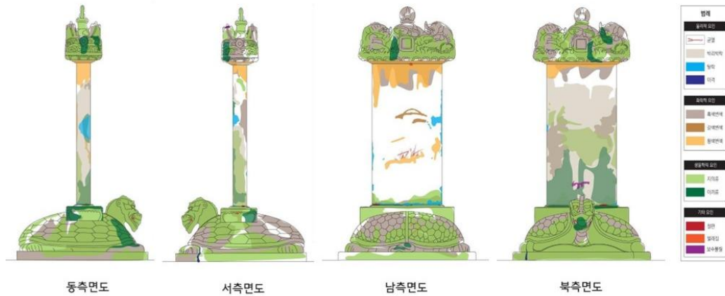
[그림 3] 괴산 각연사 통일대사탑비 풍화 훼손 지도