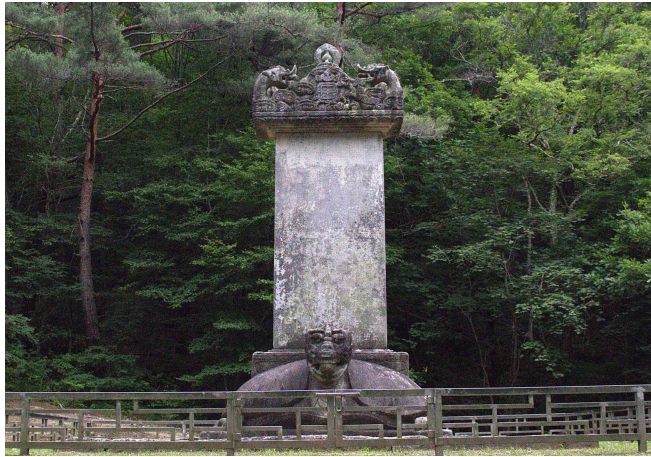
[그림 1] 과산 각연사 통일대사탑비