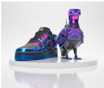
Meta-Pigeon BOSS 컬렉션